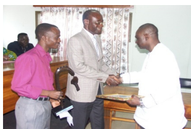
El Representante Residente de la FAO entrega el premio de OLOFINDJI

El primer evento de este taller fue la entrega de premios a las estructuras y personalidades que se han destacado por su lucha contra el hambre y la pobreza en el país.