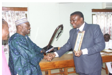
HUNGER PROJECT recibe su premio