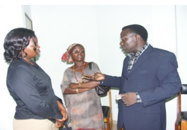
El presidente de la Alianza de Benin durante una explicación

Los premiados fueron elegidos tras un proceso de elección iniciado el 16 de octubre de 2006 y finalizado el 30 de agosto de 2007. Son cinco elegidos en las cinco categorías siguientes :