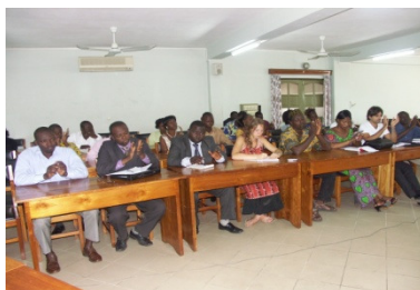
LOS PARTICIPANTES EN EL TALLER

Con motivo del Día Mundial de la Alimentación de 2007, la Alianza Nacional contra el Hambre de Benin se propuso realizar un taller entre las distintas partes interesadas para que cada una defina su papel en el proceso de elaboración de una ley para la protección del derecho a la alimentación y la seguridad alimentaria en el país. Participaron autoridades públicas (ministerios y otras instituciones de la República, municipios...); las ONG que trabajan en el ámbito del hambre, la agricultura y los derechos humanos; personalidades e instituciones internacionales (FAO, UNICEF, PMA, PNUD....).